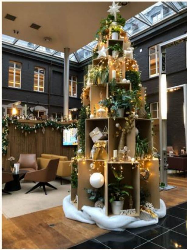
Le Modul' Arbre de Noël à partir de 3m