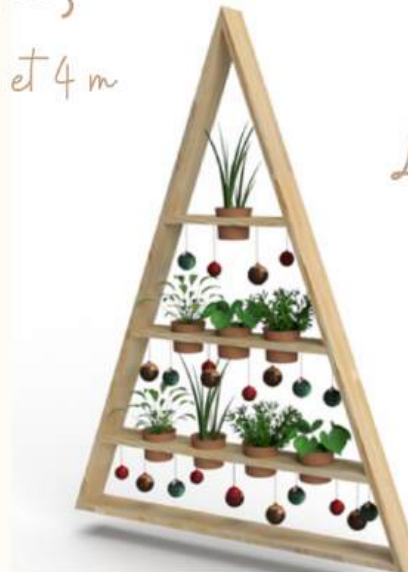
Le Triangle Végétal

il se transforme en pots pour végétaliser vos espaces de travail