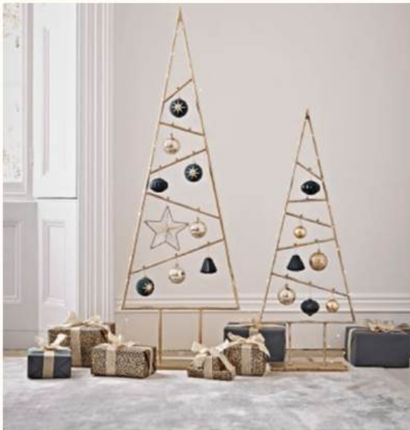
Le Triangle, existe en 2-2,5-3 et 4 m