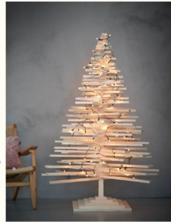
le Repliable en 2.50m